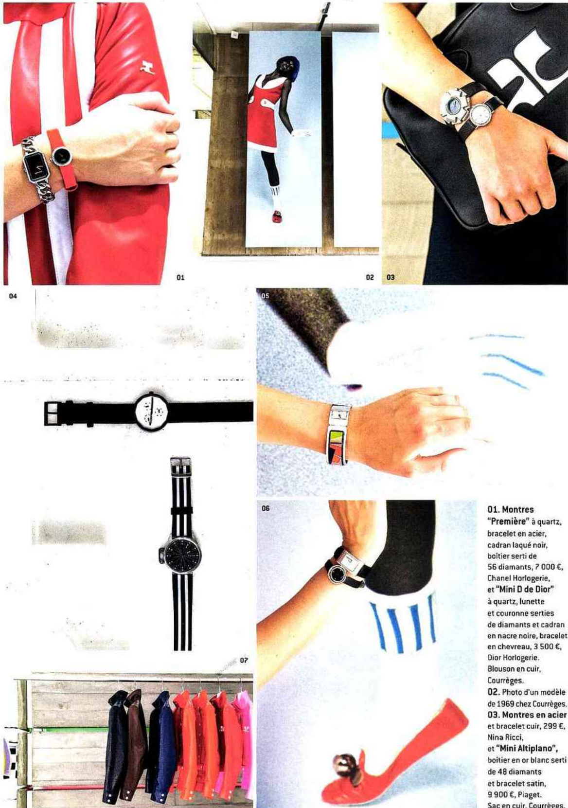
01. Montres "Première" à quartz, bracelet en acier, cadran laqué noir, boîtier serti de 56 diamants, 7 000 €, Chanel Horlogerie, et "Mini D de Dior" à quartz, lunette et couronne serties de diamants et cadran en nacre noire, bracelet en chevreau, 3 500 €, Dior Horlogerie. Blouson en cuir, Courrèges. 02. Photo d'un modèle de 1969 chez Courrèges. 03. Montres en acier et bracelet cuir, 299 €, Nina Ricci, et "Mini Altiplano" , boîtier en or blanc serti de 48 diamants et bracelet satin, 9 900 €, Piaget. Sac en cuir, Courrèges.